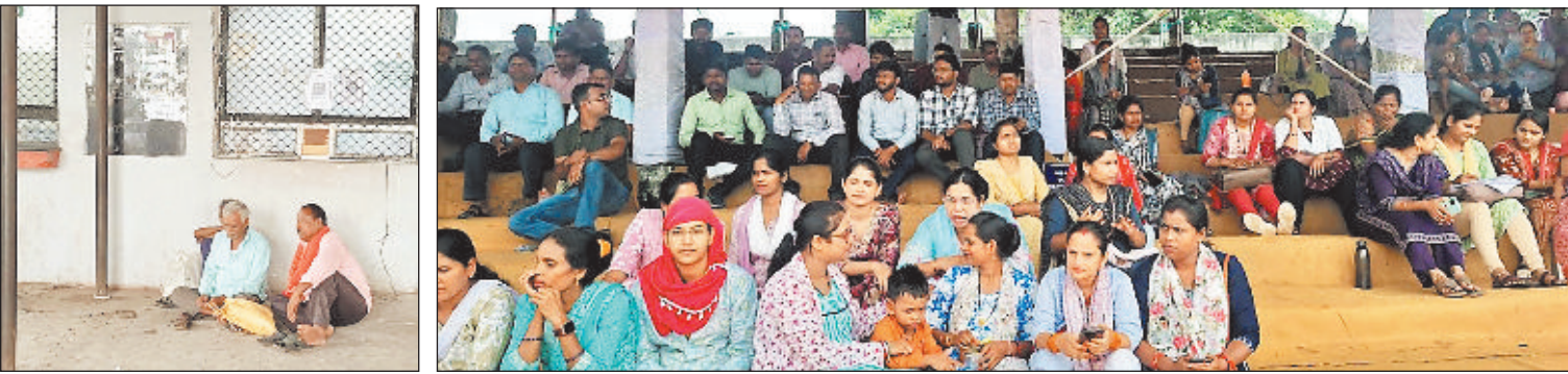
हरिभूमि न्यूज ►► रायगढ़

प्रदेशभर के 16 हजार से अधिक एनएचएम कर्मचारी अपनी 10 सूत्रीय मांगों को लेकर सोमवार से अनिश्चितकालीन हड़ताल पर चले गए हैं। इसका सीधा असर रायगढ़ जिले की स्वास्थ्य सेवाओं पर पड़ा है। जिला मुख्यालय से लेकर ग्रामीण इलाकों तक टीकाकरण, एनसीसी चेकअप, ओपीडी और एएसएनसीयू जैसी महत्वपूर्ण सेवाएं टप हो गई हैं। अकेले रायगढ़ जिले से 600 कर्मी इस हड़ताल में शामिल हुए हैं।